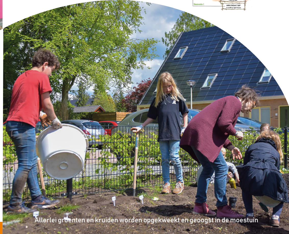
Allerlei groenten en kruiden worden opgekweekt en geoogst in de moestuin